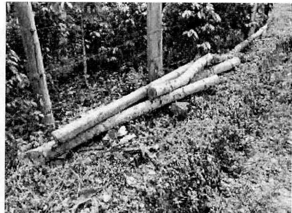
Fotografías 2 y 3. Evidencia de los residuos de la tala de los árboles.