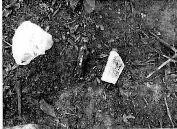
Fotografías 4 y 5. Se evidencia un árbol que lo dejaron hasta la mitad acerrado y el aceite.