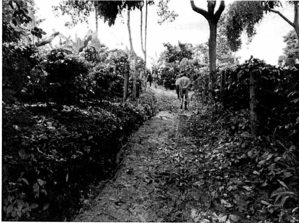
Fotografía 1. Panorámica del predio y del camino de herradura.