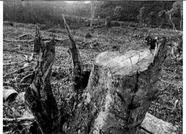
Fotografía 6. Individuo forestal talado