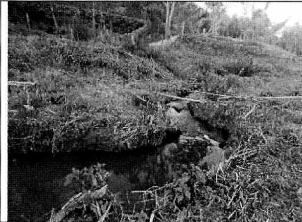
Fotografía 11. Quebrada La Muralla