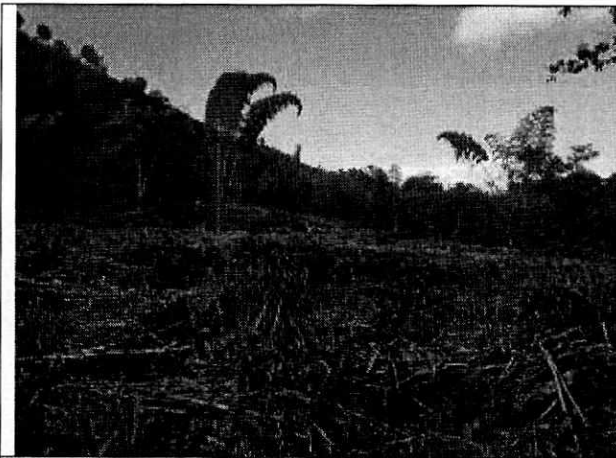
Fotografía 1. Sitio de la visita