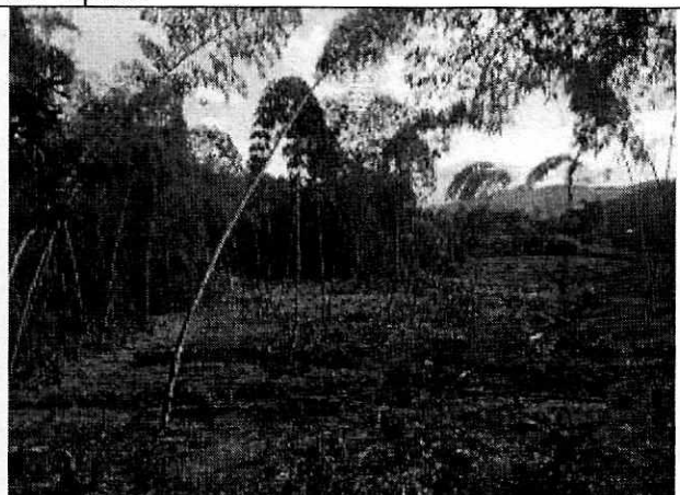
Fotografía 14. Zona de la afectación