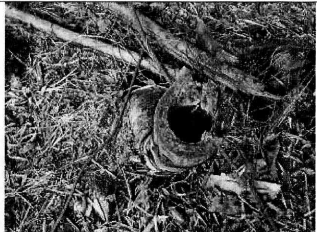
Fotografía 12. Corte incorrecto y acumulación de líquido