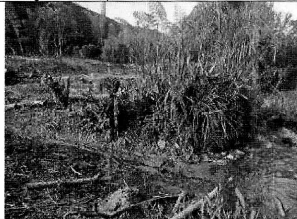
Fotografía 5. Tala con respecto a cauce del río Guachicos.