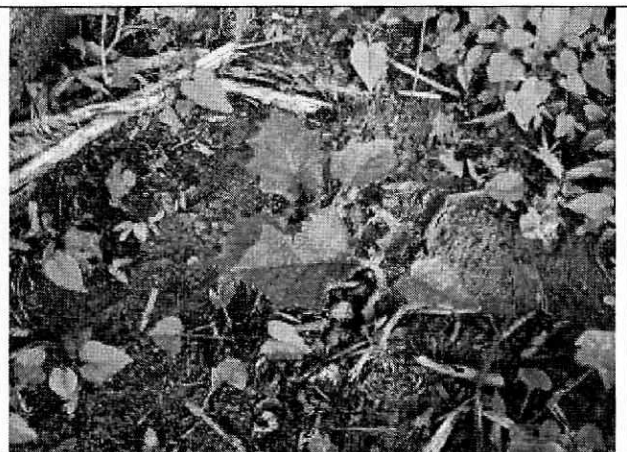
Fotografía 8. Planta de lulo