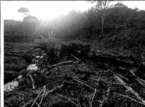
Fotografía 9. Individuos forestales talados y cauce quebrada La Muralla