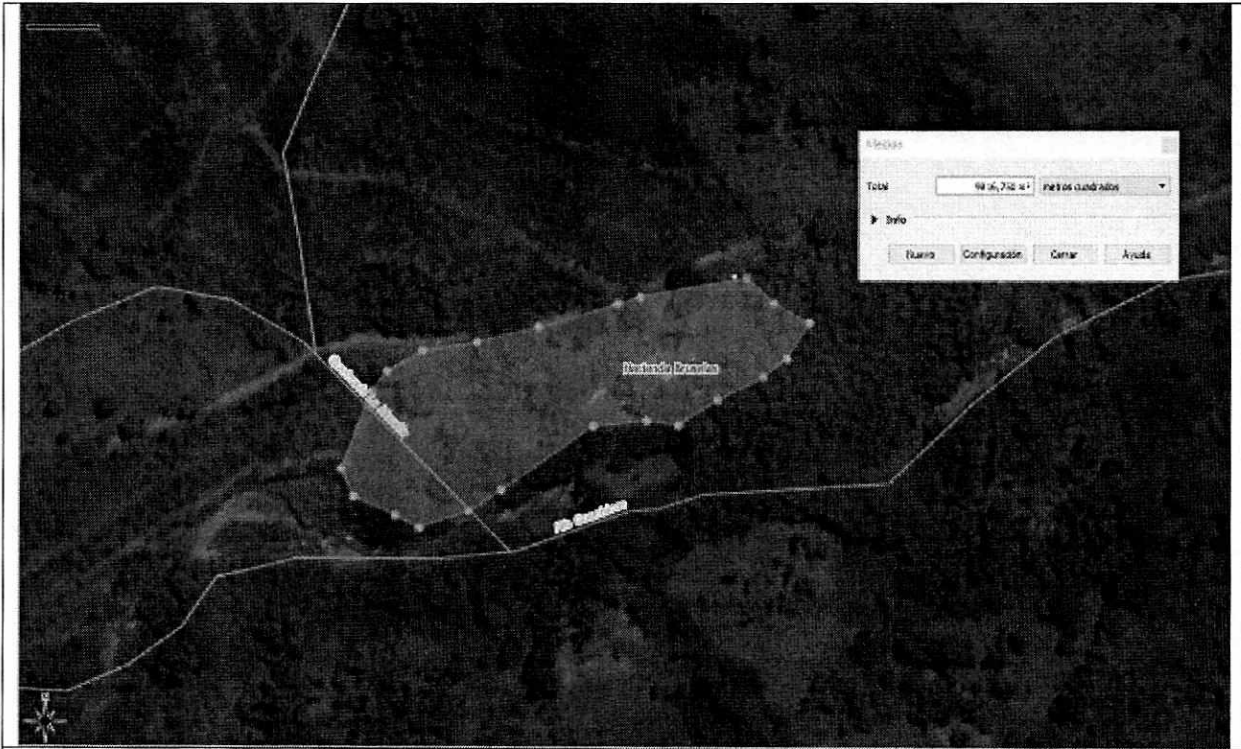
Imagen 1. Sitio visitado.