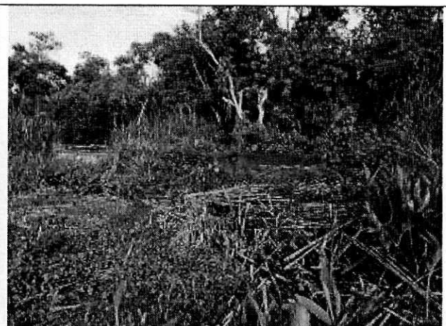
Fotografía 2. Remoción de capa vegetal sobre ribera del rio Guachicos