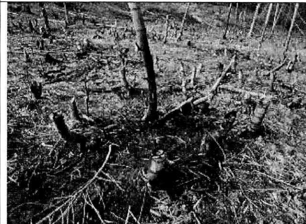
Fotografía 13. Guadua cortada e incinerada