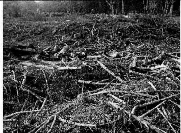
Fotografía 10. Residuos de material vegetal