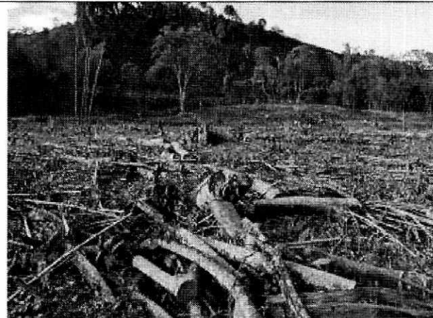
Fotografía 3. Especímenes forestales talados