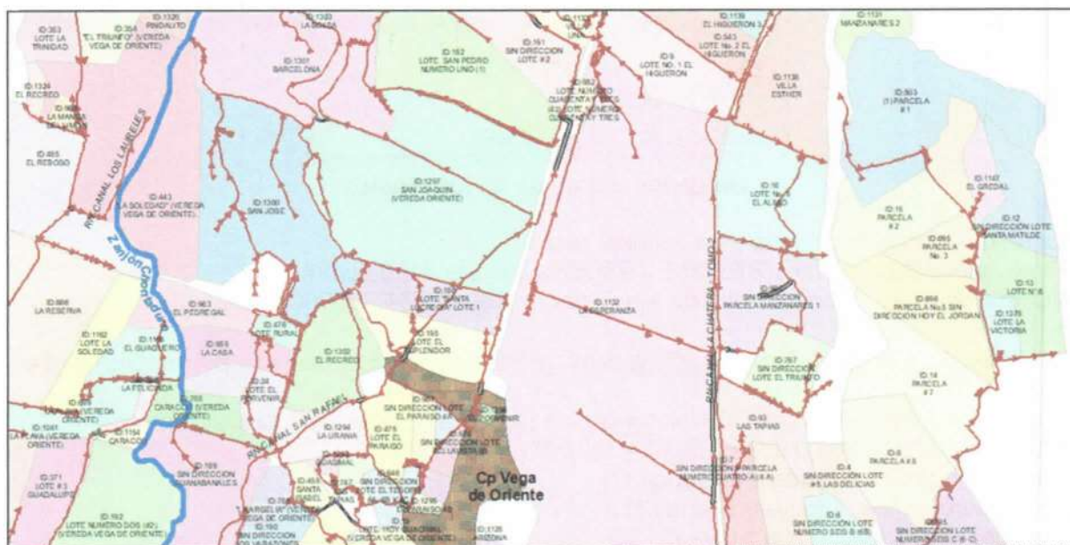
Ubicación general de los predios